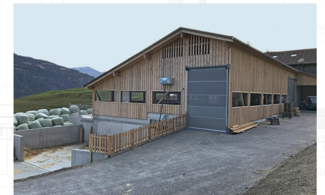
LBA Referenzobjekt 501474

Landwirtschaftliches Bau- und Architekturbüro info@lba.ch www.lba.ch